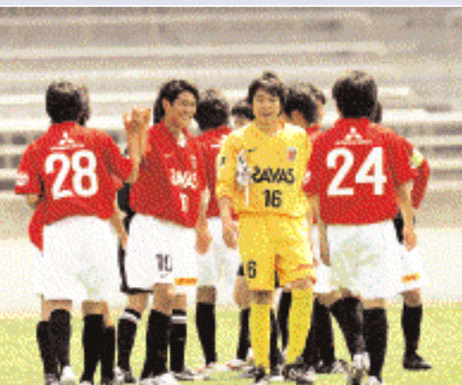
(510 / 東京Vユース戦)

僕の感覚では、後ろから作っていくということに関しては去年よりも良いくらいではないかな、と思っています。ただ相手に前から来られると難しくなるところがありますから、そこは課題です。それと、サッカーはその先が必要です。守備でも攻撃でも、ボールのところできっちり勝てないといけません。そこを強く