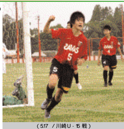
(517 / 川崎U-15戦)

チームとしては、良いところで点も取れていますが、失点もけっこうあるので、そこをなくしたいと思います。自分は去年から出ているので、経験とかを生かして、みんなの緊張などもほぐしてあげたいと思いますし、良いチームにしていきたいと思います。今年のチームは元気が良いのが一番良いことです。アップから元気よくやって、試合に元気になっていきたいです。自分のプレーとしては持久力はあると思うので、声を出しながらどんどん上がっていき、守備もできて攻撃にも参加できる選手になりたいと思います。