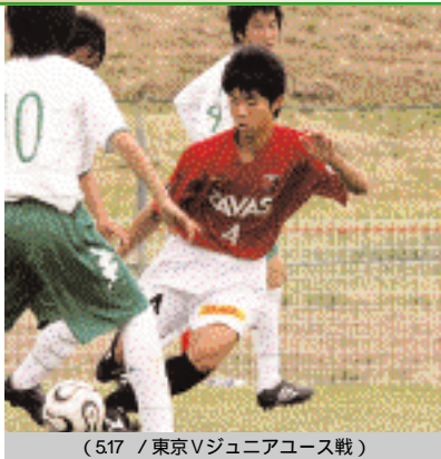
(517 / 東京Vジュニアユース戦)

最後まで諦めずにベンチも含めてみんなで一緒に戦ってきたから結果がついてきたと思います。自分は去年も出たので、みんなに声をかけて引っ張っていかないとけないと思っています。今年のチームは誰か1人でなく全員が絡んでいくサッカーです。自分のプレーとしてはまだ課題がたくさんあります。ヘディングの競り合いなども全部勝っているわけではないし、1対1のとき、あせるところもあるので落ち着いてやれるようにしたいです。関東リーグは試合時間も40分と長いので、慣れていかないとけないです。