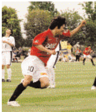
(53 / 千葉U-18 戦)

1年、2年のときにもずっとベンチに入っていたので、先輩たちがやってきたことを今年自分が発揮しないと、そのときの意味がないと思います。それはみんなに伝えていきたいです。今年のチームはパスは回せるんですが、ゴール前で我がままになる選手がいないので、もっとシュートにこだわらないといけません。自分ももっともっと動いてチームに活気が出るようにして、点にも絡んでいきたいです。チームとしては、負ける時が情けない負け方なので、もっと練習からしっかりやりたいと思います。