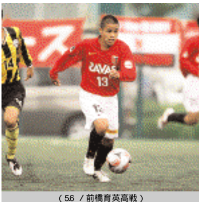
(56 / 前橋育英高戦)

ここまで良いときもあれば悪いときもありますが、最終的には勝ち越して、できるだけ高い位置で終わるようにしたいです。昨年までは中盤に良い選手が多かったので、試合に出ることもあまりなかったのですが、今年からは出場機会も増えてだいぶ馴染んできたと思います。攻撃陣なのでできるだけ自分でも点を取って、アシストもし、勝利に貢献したいです。