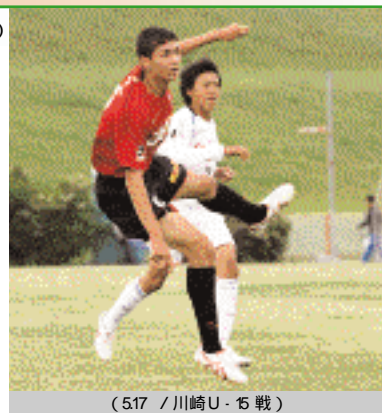
(517 / 川崎U-15戦)

Jリーグのチームがたくさんいる中で、連勝できたのは良かったと思います。自分としてはチームのために身体を張って、流れが悪いときなど引き戻したりという仕事ができたとします。まだまだですけど、高さについては得意ですけど、ドリブルがうまくないので練習していきます。またFWには厳しいマークがつくので、キープなどもしっかりしていきたいです。試合前には相手のDFに絶対勝つとか、点を決めてやろうとか、気合を入れて臨んでいます。自分も点に絡むプレーをしていきたいですし、出られない人の分まで頑張らないといけなと思います。