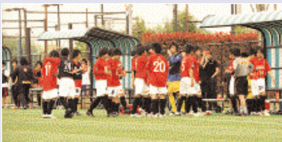
(53 / 千葉U-18 戦)

そうですね。今年は、たくさん点が入っているわけではないので、そうするとやろうとしていることと違うことをしてしまう選手も出てきてしまうと思うんですけど、そうではなくて、やっぱりずっと続けていって、何回かのチャンスの中で決まっていって、一発を狙うよりも、そういう形かなと思ってやっています。