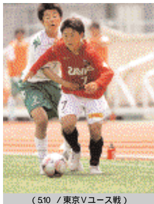
(510 / 東京Vユース戦)

初戦の鹿島戦は気持ちが入っていましたが空回りしてしまいました。三菱養和戦も勝ちたい気持ちを前面に出して戦ったんですが、0-5という結果になってしまって、個人的にもいつもどおりのプレーができなかったのは悔しいです。去年と違って爆発的な選手があまりいないですが、みんなでまとまっていけば上にもいけると言われていますので、まとまることを意識しています。みんなで勝てるようにしていきたいです。前のポジションなので、ペナルティエリアの付近ではどんどん仕掛けていって、点に絡めるようにしたいです。