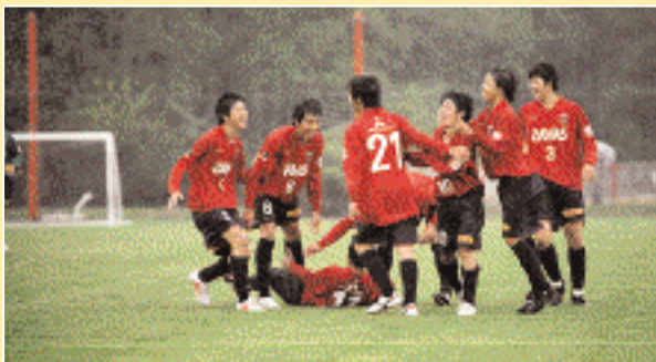
雨の中、ロスタイムに決勝点が入った横浜FCジュニアユース戦 (425)

選手に言っているのは、ヴェルディだから、FC東京だからとかいうのはやめて、毎試合自分たちが目指しているサッカー、全員がゲームに関わりながらゴールを目指し、全員で守備をするという狙いでやろうと。例えば横浜FCにはラッキーな点で勝ちましたが、でも、それも彼らの姿勢というか、誰も引き分けて終わろうと思っていなかったし、そういう意味では、ふだんからゴールに向かう、そういう姿勢が結果に表われていると思います。