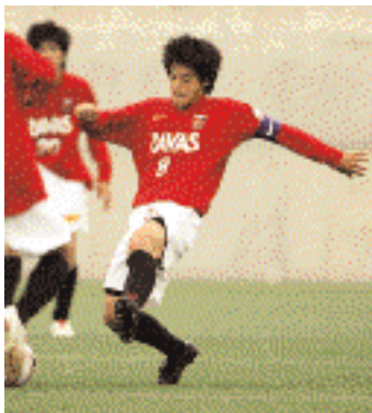
(517 / 鹿島学園高戦)

個人的なものをもっている選手が去年より少ないので、全体でパスを回しながら試合を進めています。チームとして良い感じでやれていますし、やろうとしていることは間違っていないと思いますが、点がなかなか取れないです。全国で一番になりたいという目標はありますが、1試合ずつ勝っていくしかありません。自分は去年試合に絡めた分、今年は中心になっていかないといいなと思っていますし、常に試合に出て、シーズンを通じてチームの柱になれるといいと思っています。