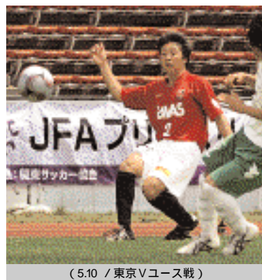
(5:10 / 東京Vユース戦)

去年も少し試合には出してもらっていましたが、今季はしっかり試合に出られるようになっていて、自分の調子は良い方だと思っています。印象深いのは、初戦の鹿島戦です。先制されて、そのあと相手の退場などもありましたが、逆転勝ちできて良かったです。残り試合全部勝つことを目標にしていますが、その中で自分がサイドからできるだけチャンスを作れるようにしたいです。