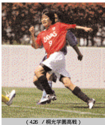
(4:26 / 桐光学園高戦)

もっと自分がチームに貢献できていれば、勝ち星が増えていたと思います。今年は去年とはまったく違うチームですし、タレントもいないですが、その分みんな取った点だという意識が強いし、自分の点ではなく、チームの点だと思います。目の前の1試合ずつを見据えて、全勝するつもりで練習からやっていかないと目指している結果は残せないと思います。先発で出たいという気持ちはありますが、ベンチに入ってもチームが勝つために何ができるかという気持ちです。